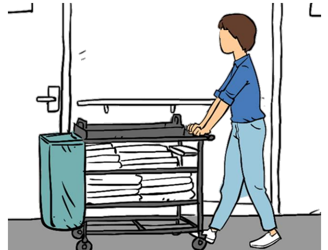
Utilizar medios auxiliares