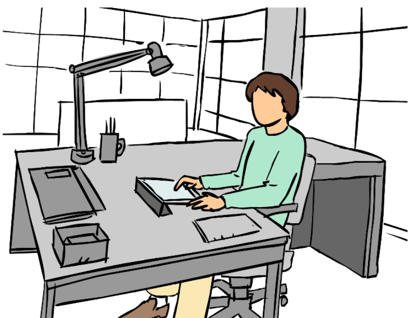
Organizar la mesa de trabajo. Espacio suficiente