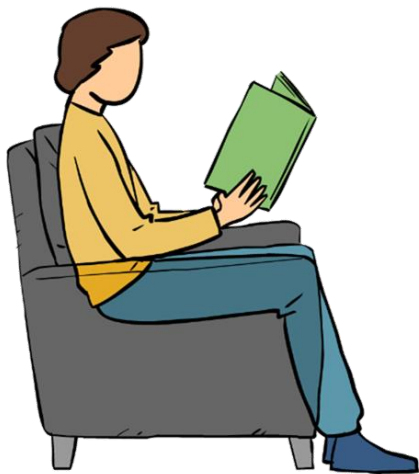
Sentarse con la espalda recta