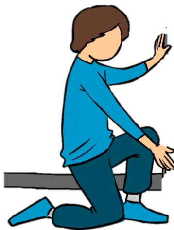
Apoyarse en la rodilla