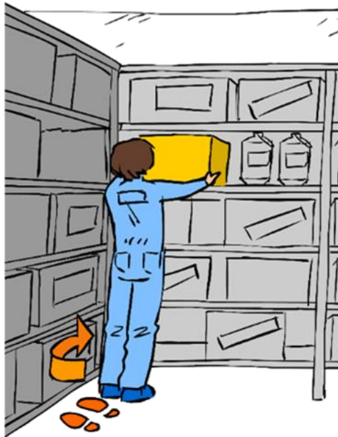
Mover los pies. Evitar los giros del tronco